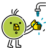
Se laver très régulièrement les mains

Enfin, pour que le protocole sanitaire n'altère pas la joie de venir voir un spectacle et la magie d'un lieu de spectacle, la bonne humeur sera de mise. Si ce protocole sanitaire vous sera remis avant le spectacle, un affichage spécial a été prévu pour les enfants dont vous trouverez quelques exemples ci-dessous.